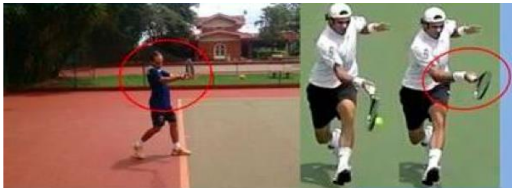
Forehand - pós-contato